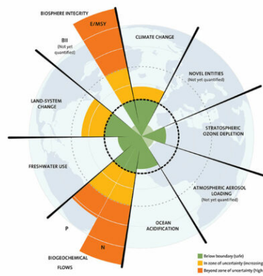
Dépassements des limites planétaires ( source )

Le s er re me nt s ac tu el s (* ), le s mu lt ip le s cr is es br ut al