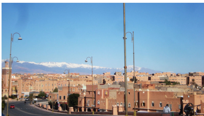
La chaîne du Haut-Atlas vue de Ouarzazate

Redressant la tête, justement, je me sens inopinément comme accueilli, appelé presque, par le paysage qui me fait face et s'ouvre très loin, très large. Au sud, donc vers Ouarzazate, me dis-je. Plusieurs fois par le passé j'avais remis à plus tard le désir de rejoindre cette ville.